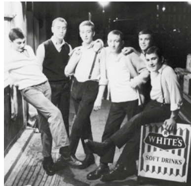
Junge Skinheads in London (1969)

Die internationale „Rechtsrock“-Szene bildete sich gegen Ende der 1970er- beziehungsweise zu Beginn der 1980er-Jahre heraus und hat ihre Wurzeln in der Skinhead-Subkultur Großbritanniens. Bis zur Entstehung des „Rechtsrock“ (auch als „Rock Against Communism“ bezeichnet) wurde rechtsextremistische Ideologie in der Musik überwiegend in Form von Heimat- und Soldatenliedern verbreitet.