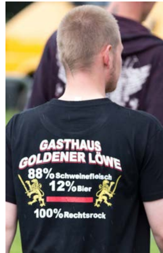
Das „Gasthaus Goldener Löwe“ in Kloster Veßra (Thüringen) war bis 2024 ein bekannter Treffpunkt und Veranstaltungsort der Szene.

Der regionale Schwerpunkt der Konzerte liegt seit Jahren in den östlichen Bundesländern, insbesondere in Sachsen. Hier kann die Szene im Vergleich zum Westen Deutschlands auf mehr szeneeigene Objekte/Grundstücke und Veranstaltungsorte zugreifen. Dazu kommen langjährig erfahrene und gut vernetzte Konzertveranstalter sowie eine ausreichend vorhandene Publikumsbasis. Der Besucherdurchschnitt der letzten fünf Jahre (2020–2024) lag bei rund 115 Personen. Konzerte mit mehr als 300 Besuchern stellten eine absolute Ausnahme dar.