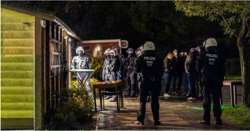
Personalienfeststellung nach Auflösung eines rechtsextremistischen Konzerts im Vereinsheim einer Kleingartenanlage in Gelsenkirchen (Nordrhein-Westfalen)

Zudem werden bekannt gewordene Ausrichtungsorte auf die Einhaltung bau- und veranstaltungsrechtlicher Bestimmungen überprüft. Wenn diese nicht erfüllt sind, können auch auf diesem Wege Veranstaltungen im Vorfeld verhindert werden.