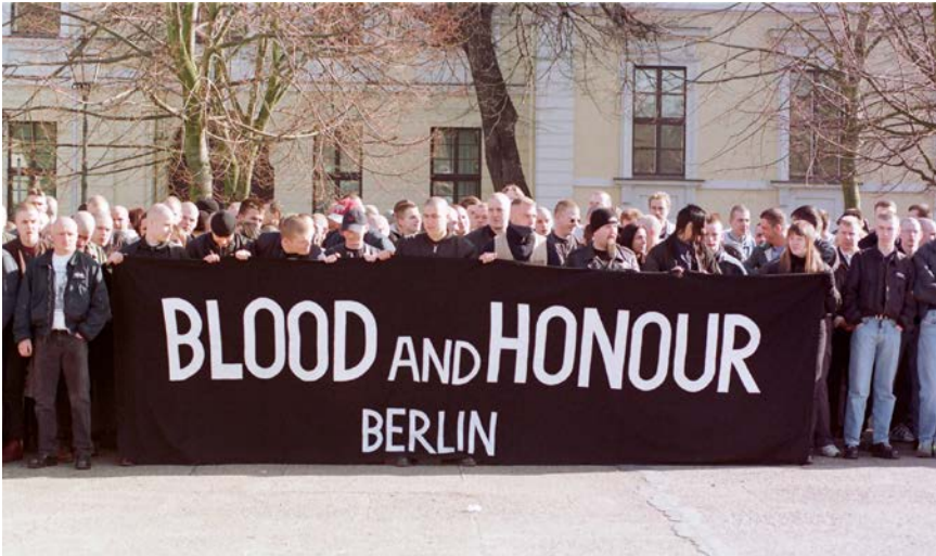
Mitglieder von B&H Berlin auf einer Demonstration der rechtsextremistischen Partei NPD („Nationaldemokratische Partei Deutschlands“ 10 )

ihrem Verbot unzählige konspirative Konzerte und produzierte beziehungsweise verbreitete Tonträger mit teils strafbaren und volksverhetzenden Inhalten.