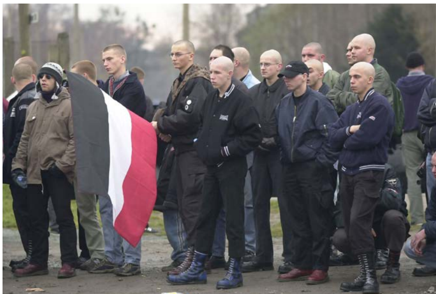
Äußeres Erscheinungsbild rechtsextremistischer Skinheads

Zunächst dominierten im „Rechtsrock“ Liedtexte, die sich um den „Way of Life“ der Skinheads drehten (Alkoholexzesse, Fußballerlebnisse und Randalen) und eine ausgeprägte Fremdenfeindlichkeit zum Ausdruck brachten. In den 1990er-Jahren verschärften sich die Texte dann inhaltlich. Nun wurde offen zu Rassenhass und Gewalt angestachelt, der historische Nationalsozialismus verherrlicht und antisemitische Propaganda verbreitet.