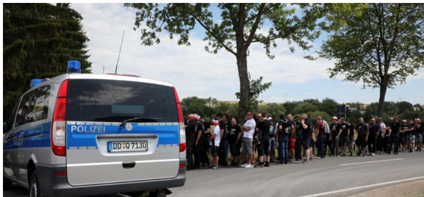
Einlasskontrolle der Polizei bei „Rock gegen Überfremdung“ in Themar 2019

der nationalen Bewegung“, die zuletzt im Jahr 2019 mit einschneidenden Auflagen stattfanden. Am ersten „Schild & Schwert-Festival“ im April 2018 nahmen rund 1.300 Personen teil, im Juni 2019 waren bei der Neuauflage insgesamt nur noch 700 Besucher vor Ort.