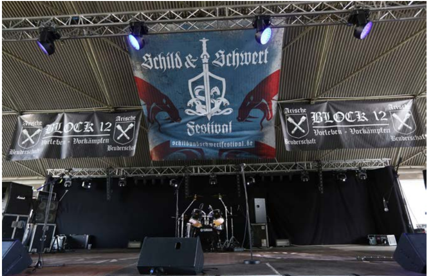
Bühne des „Schild & Schwert-Festivals“ 2018

diesem Segment erfuhr die Veranstaltung „Rock gegen Überfremdung – Identität und Kultur bewahren – Rede- und Musikbeiträge gegen den Zeitgeist“ am 15. Juli 2017 in Themar (Thüringen), an der rund 6.000 Personen teilnahmen. Begünstigt wurden solche Veranstaltungen auch dadurch, dass sie von den Organisatoren zum Teil als Versammlungen angemeldet worden waren und daher unter dem besonderen Schutz des Versammlungsrechts stattfanden. 32